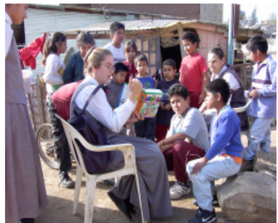
Eine Kinderstunde in den Bergen von Ensenada

Wir sind dem Herrn dankbar für Sein Wirken hier in Baja und schätzen sehr die Gebete der Heiligen. Betet weiter!